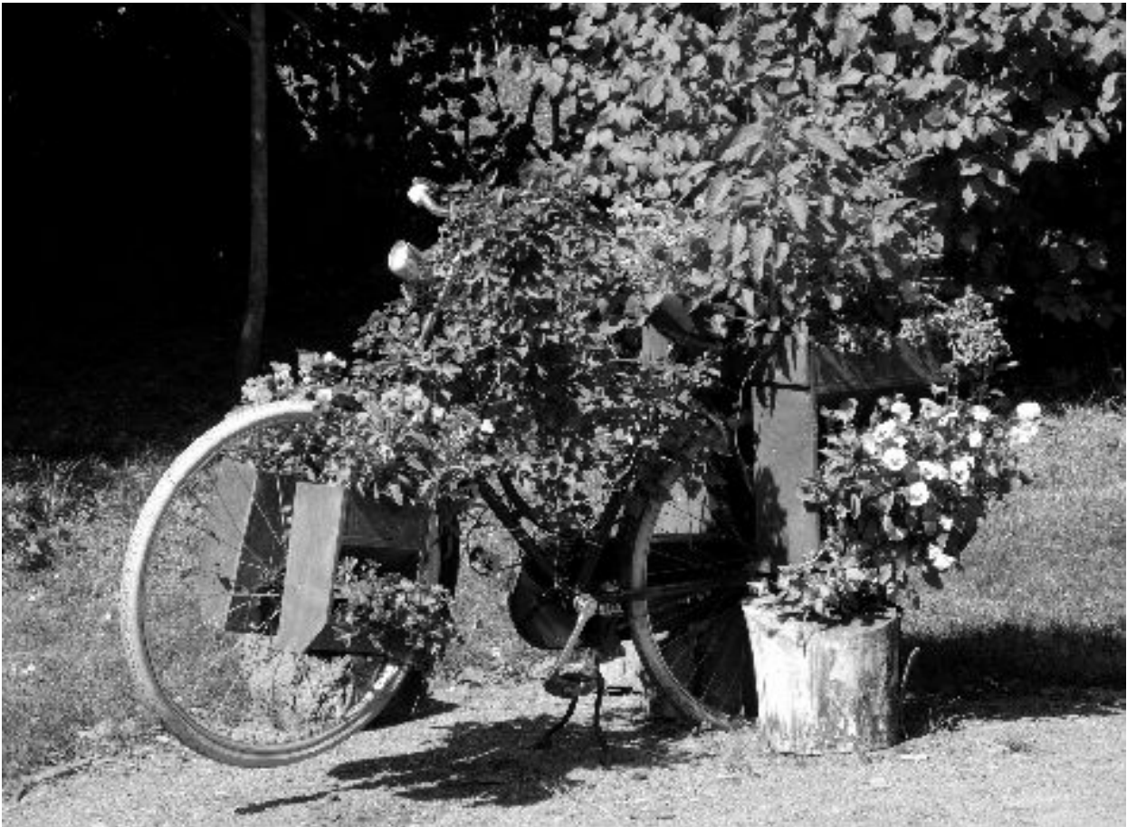
door'trapper, m. (-s), fiets zonder vrijwiel.